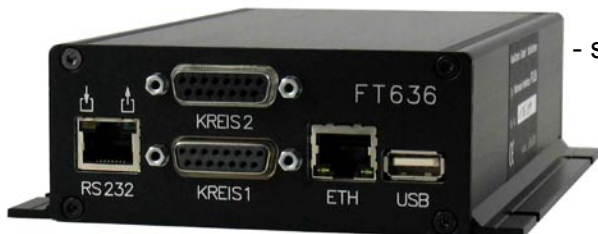
- schwarzes Alu-Flansch-Gehäuse

Das FT636 IP Interface ist in zwei verschiedenen Gehäusen lieferbar: