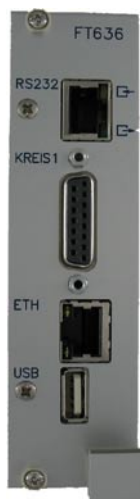
- 19 Zoll Einschub-Kassette